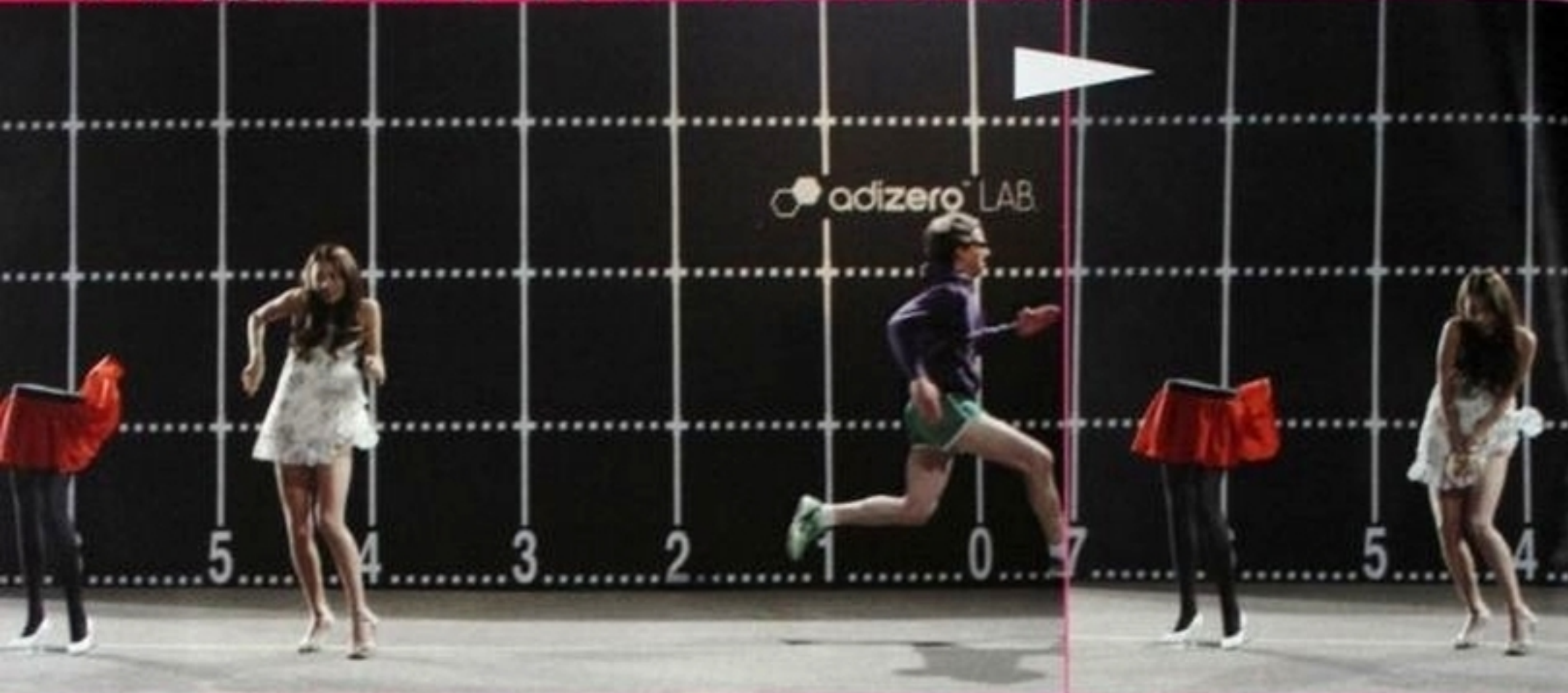
男性が全力で走り抜けると、やりかたのワンピの裾がらむわ