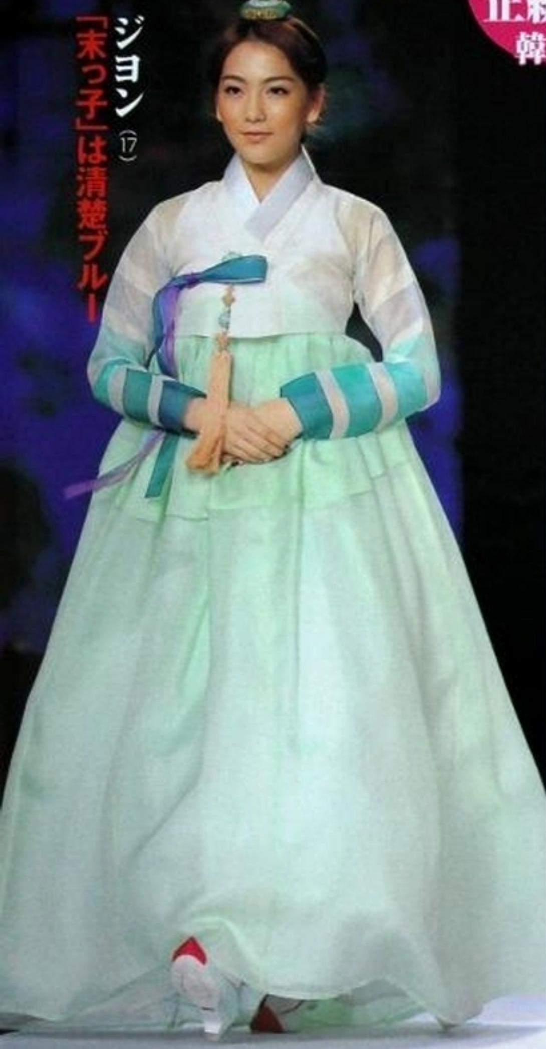
ジムで脚をトレーニングする様子をツイッターで紹介し、「華外に怪力!」と話題に