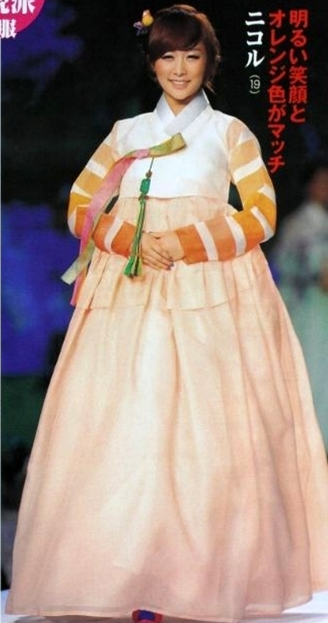
8月で日本デビュー1周年を迎え「新しい姿をいつも見せるように頑張る」と宣言